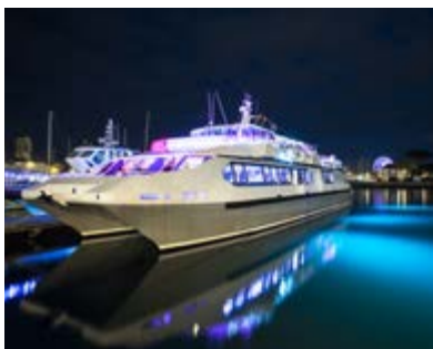
Compagnie Interîles - Cour des Dames 17000 LA ROCHELLE