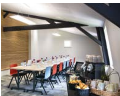
13 rue Sardinerie 17000 LA ROCHELLE