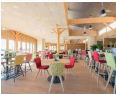
22, avenue Paul Langevin 17180 PÉRIGNY