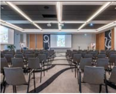
Quai Louis Prunier 17000 LA ROCHELLE