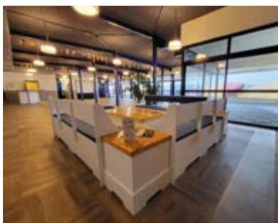
Place Bernard Moitissier 17000 LA ROCHELLE