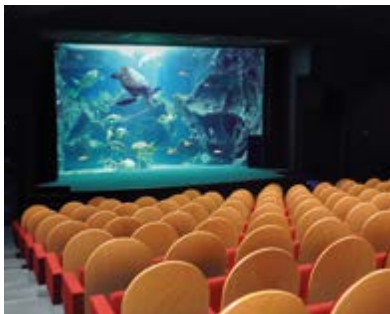
Quai Louis Prunier 17000 LA ROCHELLE