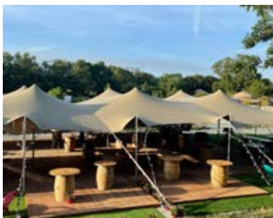
Chemin de Ronflac 17220 LA JARNE