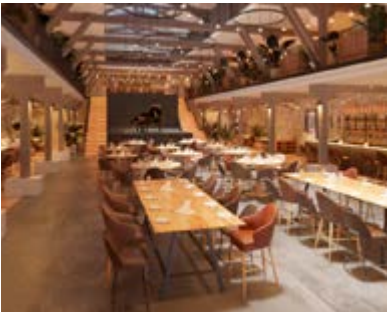
162 ter, boulevard Emile Delmas - La Pallice 17000 LA ROCHELLE