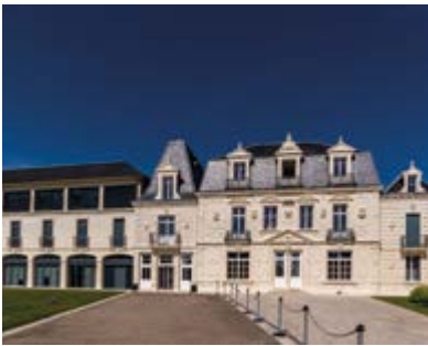
51, boulevard de la République 17340 CHÂTELAILLON-PLAGE